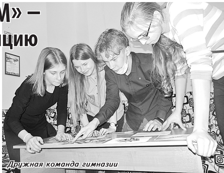
Дружная команда гимназии

Участники проявили высокий уровень знаний в самых разных областях, способности к логическому мышлению, а дружная командная работа помогла быстро находить верные ответы на вопросы.