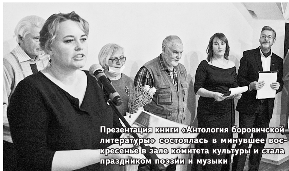
Презентация книги «Антология боровичской литературы» состоялась в минувшее воскресенье в зале комитета культуры и стала праздником поэзии и музыки