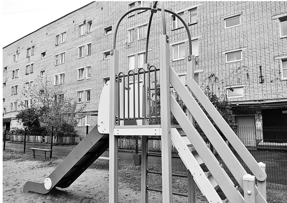
Детская площадка на набережной 60-летия Октября, 7

В этом году победителями городского конкурса на лучшую дворовую территорию признаны дома на набережной 60-летия Октября, 5 и Ленинградской, 44. Они заняли первое и третье ме-